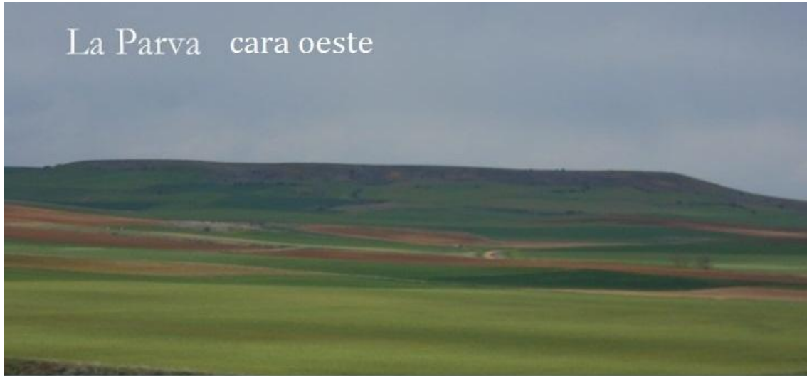
LA PARVA: CARA OESTE