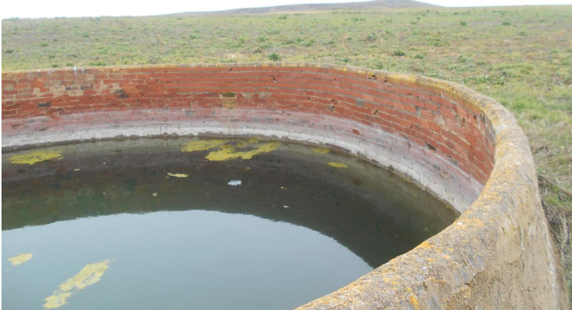
LA PARVA ARRIBA, EL POZO ABAJO Y A REBOSAR DE AGUA

El otero más grande de la comarca de Los Oteros: La Parva Secos de Coyanza.